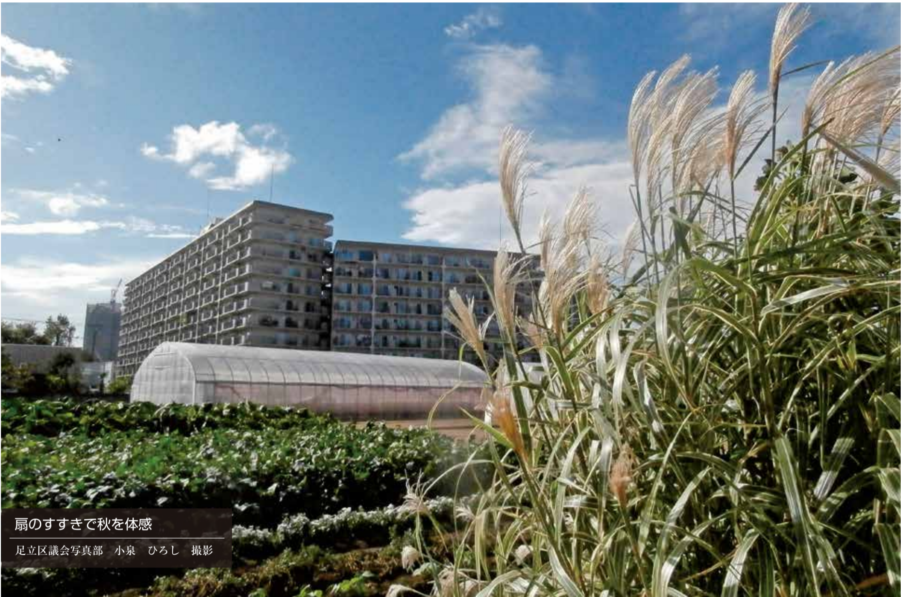
扇のすすきで秋を体感