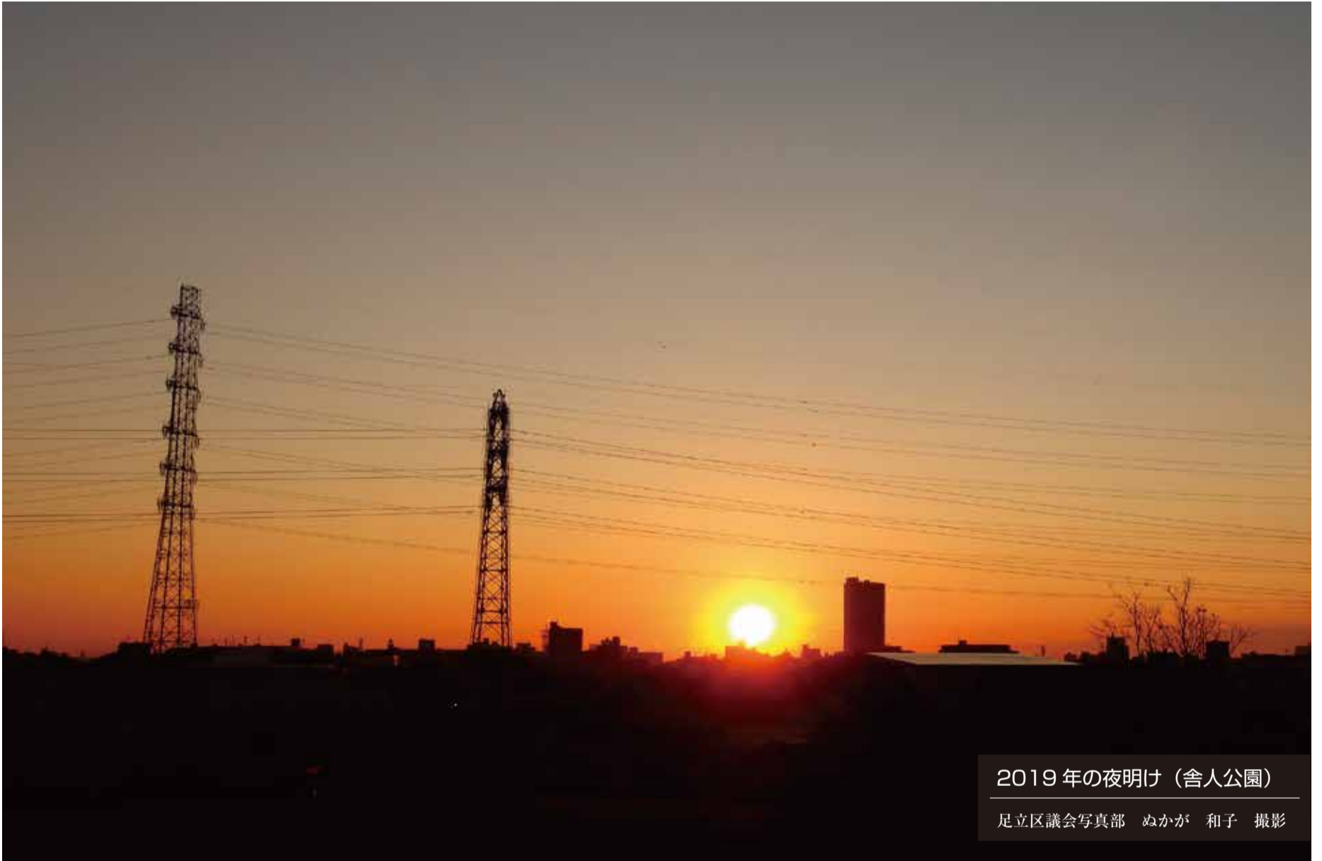
2019年の夜明け(舎人公園)