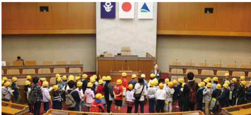
▼区立洲江小学校のみなさん

初めて見る議場の大きさに当初は驚いた様子でしたが、事務局職員による議会や議場の説明が終わり、自由に議場内を見学する時間になると、議長席に座ったり、演壇に上がったりして、思い思いの時間を過ごしていました。