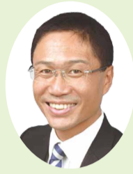
議長 かねだ 正