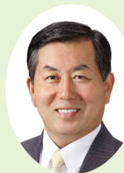
議長 高山のぶゆき

区民の皆さまには、平素より区政並びに区議会に対しまして、格別のご理解・ご支援を賜り、厚くお礼を申し上げます。