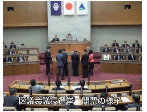
区議会議長選挙 開票の様子

マンション敷地内のごみ集積所において、ごみ収集作業中の職員が手に持っていたごみ袋が誤って駐車中の車に接触し破損させ、損害を与えた額(19万9千140円)の決定